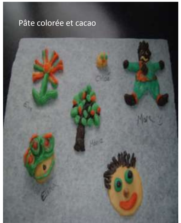
Pâte colorée et cacao