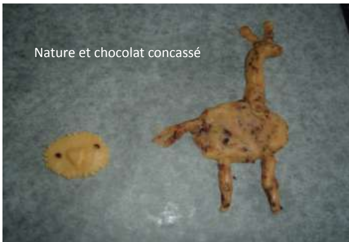
Nature et chocolat concassé