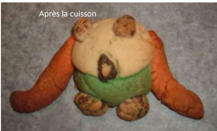
Après la cuisson